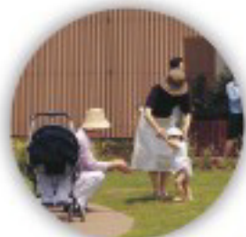
芝生であんよの練習

折々に咲き誇る草花には、かつて里山で見られた植物を織りこみ、親しみやすさとともに懐かしさも感じていただける庭園としました。また、車イスでも回遊できるバリアフリー化も行っています。