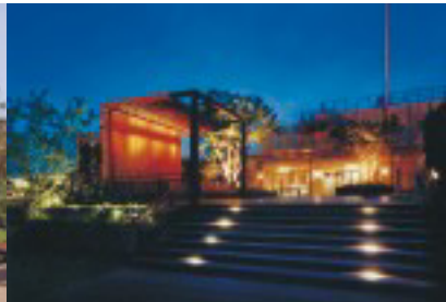
ライトアップされた月見台