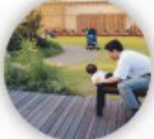
お休みの日はお父さんと