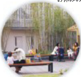
平日はお母さんと