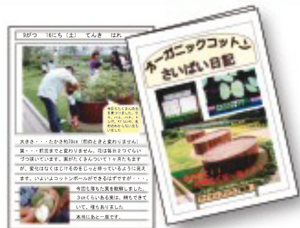
成長記録を貼付していく「さいばい日記」