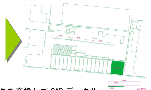
活用例：ドローンのデータを変換して CAD データ化